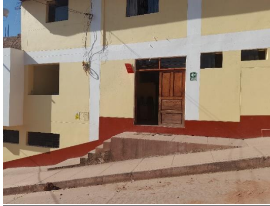
Vista frontal, fachada lateral