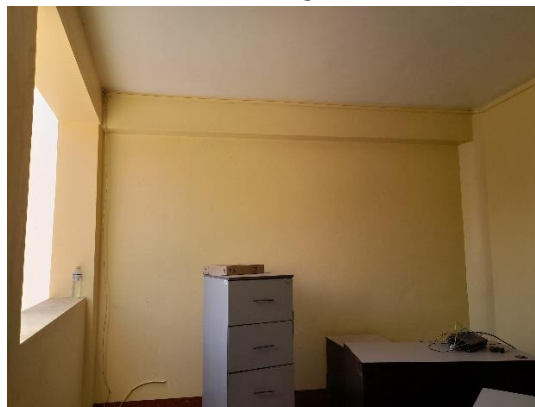
Ambiente asignado para el Alegria

Esta es una copia auténtica imprimible de un documento electrónico archivado por el Ministerio de Justicia y Derechos Humanos, aplicando lo dispuesto por el Art. 25 del D.S. 070-2013-PCM y la tercera Disposición Complementaria final del D.S. 026-2016-PCM. Su autenticidad e integridad pueden ser contrastadas a través de la siguiente dirección web: https://sgd.minjus.gob.pe/gesdoc_web/login.jsp e ingresando el Tipo de Documento, Número y Rango de Fechas de ser el caso o https://sgd.minjus.gob.pe/gesdoc_web/verifica.jsp ingresando Tipo de Documento, Número, Remitente y Año, según corresponda.”