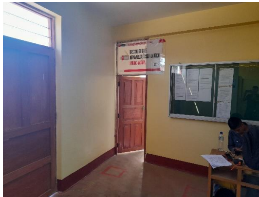
Hall de ingreso